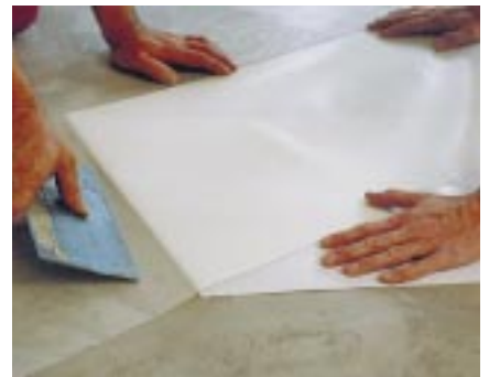
...t 2000 durch einfaches andrücken auf dem untergrund be- festigen und darauf achten, dass keine luftblasen entstehen. achtung: zwischen den bahnen einen abstand von drei bis fünf millimetern einhalten

umweltzertifikate für thomsit-produktionsstandort: