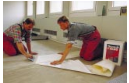
schnelligkeit ist keine hexerei: high-tack®-bahn ausrich- ten, schutzpapier von klebstoffbeschichteter unterseite abziehen...