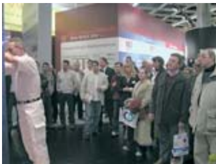
reges interesse fanden die produktpräsentation des technik-chefs der firma diessner.

viele unserer lieferantenpartner zeigten ebenfalls präsenz und einige unter ihnen hatten interessante, innovative produkte im gepäck. als der spezialist für maschinentechnik hatte die firma wagner oberflächentechnik einen der größten messestände platziert. neben der ausstellung der produktneuheiten ging es wagner vor allem darum, die funktionalität und effektivität von maschinentechnik zu zeigen. in praktischen vorführungen wurden die maschinen auf herz und nieren getestet und die besucher für die high-tec-spritzanlagen begeistert.