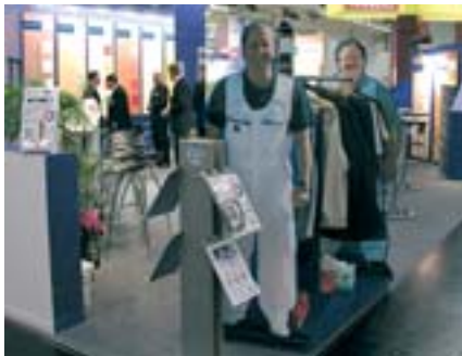
die eigens für maler und bodenleger konzipierte arbeitsbekleidungskollektion von bito.

nach vier tagen farbe 2005 am messeplatz köln steht fest: die internationale branchenleitmesse ist – auch im Hinblick auf ihre neukonzeption unter einbindung der bereiche stuck, putz, trockenbau – ein allseits anerkannter großartiger erfolg! bito – der freundliche großhandel präsentierte sich erstmals auf der wichtigsten farbenmesse europas. in zusammenarbeit mit der lack- und farbenfabrik diessner wurden die neuesten produkt und verarbeitungstechniken aus dem dekoberreich gezeigt und was die neue, eigens für maler und bodenleger konzipierte, arbeitsbekleidungslinie leisten kann.