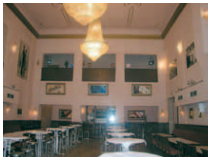
das „queens 45“ in der königin-elisabeth-sträÙe 45 in 14059 berlin-charlottenburg ist die location des diesjährigen wirtschaftstreffs.

„die initiative pro berlin ist eine klasse idee, nur muss diese auch durch unsere taten weiter getragen werden. ich war beim letzten treffen nicht dabei, habe aber von kollegen gehört, dass sich die teilnahme absolut lohnt und ich hier die möglichkeit habe, mich aktiv einzubringen. klar bin ich diesmal dabei! mein urteil lautet:“