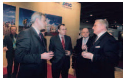
eröffnungsrundgang: peter strieder, senator für stadtentwicklung

scheider wie sie! darum: besuchen sie uns am 22.02.06, um 11.00 uhr am „innung.org-stand“. nehmen sie teil an unserer pressekonferenz und erleben sie den offiziellen startschuß des diesjährigen fassadenwettbewerbs. sie sind herzlich eingeladen!