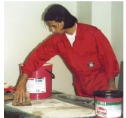
anwendungsdemonstration für entscheidungsträger: ein mitarbeiter des portugiesischen marktführers in der fußbodentechnik präsentiert thomsit k 188 e. rechts im bild steht noch ein klebstoff-eimer mit dem alten etikett.