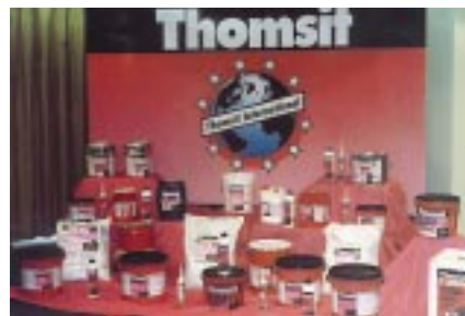
thomsit-produkte sind überall in der welt zu erkennen.

mit dieser milleniums-aktion feierte thomsit ende letzten jahres den gelungenen relaunch seiner fußboden-systeme und die neue profi-ausrichtung in portugal. auf den ersten blick unterscheiden sich die portugiesischen kleber, spachtelmassen und vorstriche nicht von ihren deutschen gegenstücken. erst die portugiesische und spanische beschriftung der etiketten verrät, dass es sich um internationale gebinde handelt. für die portugiesen indes