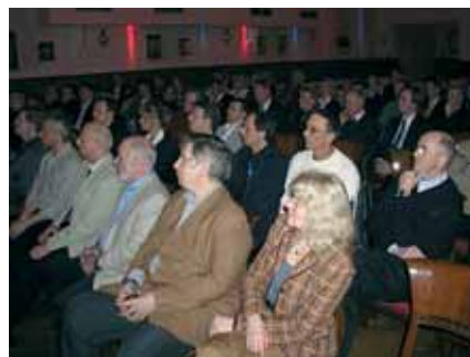
interessiert verfolgten die zahlreichen besucher des wirtschaftstreffs die podiumsdiskussion

vielleicht sind auch sie beim nächsten wirtschaftstreff dabei?