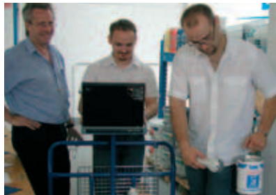
modernste technik im qualifizierten abholmarkt.

bito hat ein neues malerdepot in berlin-reinickendorf eröffnet. auch am neuen standort erhalten sie die breite palette der bito-produkte für ihren täglichen bedarf und die markenprodukte unserer beiden lieferantenpartner diessner und sigma. selbstverständlich profitieren sie auch dort von unseren herausragenden service- und logistik-leistungen.