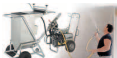
mit dem einfach zu montierenden behälter können große flächen ohne weiteres nachfüllen gespachtelt werden.

quickclean-system zur selbstreinigung der pumpeneinheit in nur 7 minuten, sowie eine verbesserte service- und wartungsfreundlichkeit.