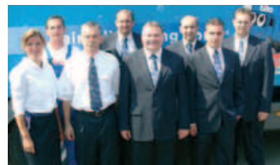
das mitarbeiterteam der bito hamburg gmbh

starke bito-sortiment und die praktischen, geldsparenden service- und dienstleistungen bilden auch in hamburg die erfolgsgrundlage des unterneh-