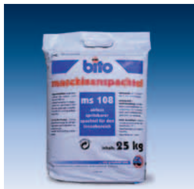
rationell und schnell – der maschinenspachtel ms 108 von bito