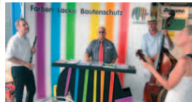
langjährige partnerschaft: der caparol-stand auf der eröffnungsfeier der bito hamburg gmbh.

unsere mitarbeiter nun auch die hamburgener handwerkerschaft. sie finden unser komplettes produkt- und leistungsspektrum in der schnackenburgallee 54 in 22525 hamburg bei der bito hamburg gmbh und die produkte des täglichen bedarfs im bito-malerdepot steilshoop, steilshooper allee 49-53, 22309 hamburg.