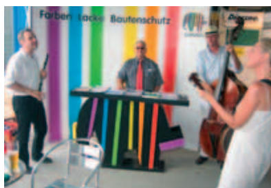
langjährige partnerschaft: der caparol-stand auf der eröffnungsfeier der bito hamburg gmbh.

standen gemeinsam mit den produkt- und servicekomponenten der markenhersteller, wie z. b. caparol, im fokus. und selbstverständlich kam auch die kontaktpflege nicht zu kurz.