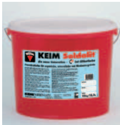
rationell und universell arbeiten – keim soldalit macht es möglich.

soldalit zeichnet sich besonders durch seinen universellen charakter aus. denn mit soldalit können sie mineralische und auch organische untergrün-