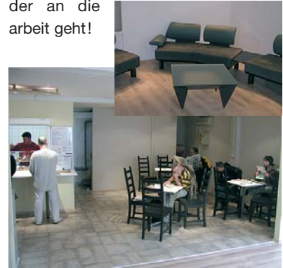
das neue bito express-bistro und die neue bito-lounge: gönnen sie sich einen moment der ruhe und entspannung, bevor es wieder an die arbeit geht.

gönnen sie sich einen moment der ruhe und entspannung, bevor es wieder an die arbeit geht!