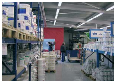
das innovative konzept „qualifizierter abholmarkt“: der kunde hat direkten zugang zu weiten teilen des lagerbereiches.

zudem erhalten sie eine noch effektivere beratungsleistung, da kunde und