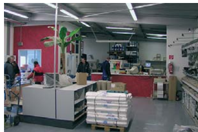
nach umfangreichen baumaßnahmen eröffnete am 01.02.07 der „qualifizierte abholmarkt“ bei bito in berlin-wilmersdorf.

jetzt ist es endlich soweit: nach fast einjährigen umfangreichen renovierungs- und umbaumaßnahmen öffnete der „qualifizierte abholmarkt“ bei bito in berlin-wilmersdorf in der bielefelder straße 6 am 1. februar 2007 seine pforten. das innovative, an den wünschen und bedürfnissen der kunden orientierte konzept optimiert den bestell- und abholprozeß und hält für die kunden eine vielzahl von erleichterungen sowie zusätzliche service- und beratungsleistungen beim einkauf parat.