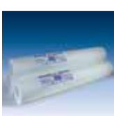
bito saniervlies sv 140