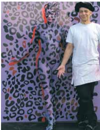
so schön kann farbe sein – die body-painting performance.

viel verführerisches bekamen die gäste beim diesjährigen bito-fest in wilmersdorf präsentiert. so wurden nicht nur die neuen zeit- und geldsparenden technologien bito perfect spray für den effizienten lackauftrag, das b.o.s.-system für nebelarmen farbauftrag und die bito wassernatter zum schnellen ablösen von tapeten auf der show-bühne vorgeführt, sondern mit