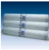
bito glasgewebe gw