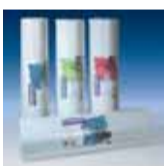
bito pro struktur rauhfaser