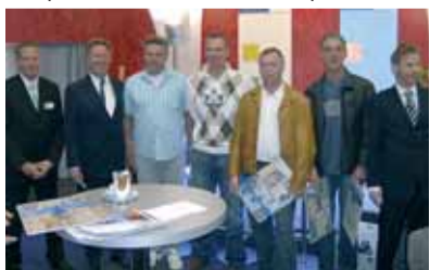
die sieger des berliner fassadenwettbewerbs.

mit einem von bito eingerichteten shuttle-service per flugzeug oder bahn konnten viele kunden aus berlin-brandenburg und norddeutschland der wegweisenden messe beiwohnen. darüber hinaus wurden die sieger des diesjährigen berliner fassadenwettbewerbs, den bito als sponsor begleitete, der presse und öffentlichkeit präsentiert.