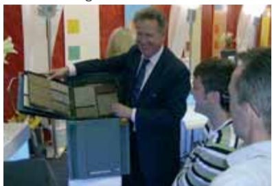
der bito bodenbelagssysteme, im fokus des interesses der messebesucher aus dem in- und ausland.

ein überzeugender auftritt gelang der bito ag auf der wichtigsten branchenmesse, der farbe 2007 in köln. auf dem gemeinsamen stand mit dem „initiative pro berlin“ – partner, der diessner gmbh, wurden die neuheiten im bito sortiment, wie z.b. das nanotec fassadensystem oder die bito bodenbelagssysteme, den zahlreichen interessierten messebesuchern aus dem in- und ausland vorgestellt.