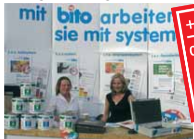
bito präsentiert sich als systemdienstleister.