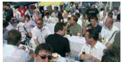
„volles haus“ beim diesjährigen bitofest in wilmersdorf.