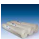
bito rollenmakulatur rm 125

chenden profi-produkte vorge-stellt. das bito innenwandssystem wird so zur perfekten anleitung für kreatives, farbiges und gleichzeitig effizientes arbeiten im system!