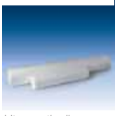
bito creativ vlies