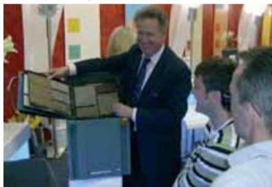
der bito bodenbelags-systainer, im fokus des interesses der messebesucher aus dem in- und ausland.

ein überzeugender auftritt gelang der bito ag auf der wichtigsten branchenmesse, der farbe 2007 in köln. auf dem gemeinsamen stand mit dem „initiative pro berlin“ – partner, der diessner gmbh, wurden die neuheiten im bito sortiment, wie z.b. das nanotec fassadensystem oder die bito bodenbelags-systainer, den zahlreichen interessierten messebesuchern aus dem in- und ausland vorgestellt.