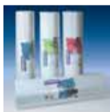
bito pro struktur rauhfaser