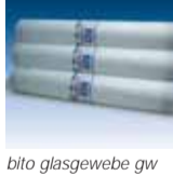
bito glasgewebe gw