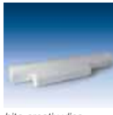
bito creativ vlies