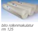
bito rollenmakulatur rm 125

chenden profi-produkte vorge-stellt. das bito innenwandssystem wird so zur perfekten anleitung für kreatives, farbiges und gleichzeitig effizientes arbeiten im system!