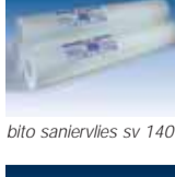
bito saniervlies sv 140