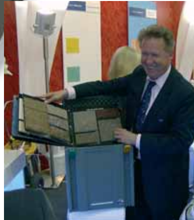
der bito bodenbelagssystemer, im fokus des interesses der messebesucher aus dem in- und ausland auf der „farbe 2007“.

gerechtes und individuelles angebot möglich, unnötige wege und viel zeit werden gespart. in der vielfältigen auswahl unterschiedlicher bito bodenbeläge finden die kunden mit sicherheit den passenden belag.