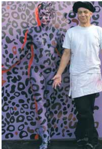
so schön kann farbe sein – die body-painting performance.

viel verführerisches bekamen die gäste beim diesjährigen bitofest in wilmersdorf präsentiert. so wurden nicht nur die neuen zeit- und geldsparenden technologien bito perfect spray für den effizienten lack-