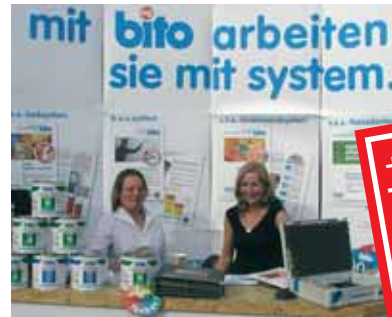
bito präsentiert sich als systemdienstleister.

bühne vorgeführt, sondern mit live body-painting und leckereien vom grill attraktives für auge und gauden geboten.