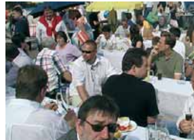
„volles haus“ beim diesjährigen bitofest in wilmersdorf.