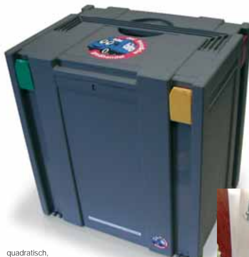
quadratisch, praktisch, professionell: mit dem neuen bito bodenbelagssystemer gelingt ihnen stets ein überzeugender auftritt bei ihren kunden.

die neuen bito bodenbelagssystemer erweisen sich immer mehr als erfolgsgeschichte bei den bodenlegern. die durchweg positive resonanz für das produkt resultiert aus den großen vorteilen, die die praktischen, quadratischen und stapelbaren systemer mit sich bringen: die wichtigsten bito bodenbelagskollektionen, ob laminat, pvc oder textile beläge, können jetzt bequem in einem komfortablen behälter zum kunden transportiert und diesem zur ansicht vorgelegt werden. somit ist sofort ein bedarfs-