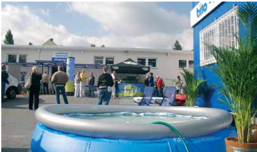
sommer in berlin – der pool blieb angesichts der kühlen witterung unbenutzt. die bito-kunden hatten dennoch großen spaß.

suche erhalten und überzeugte danach als „fallendes kunstobjekt“. kunden und gäste hatten ihren spaß!