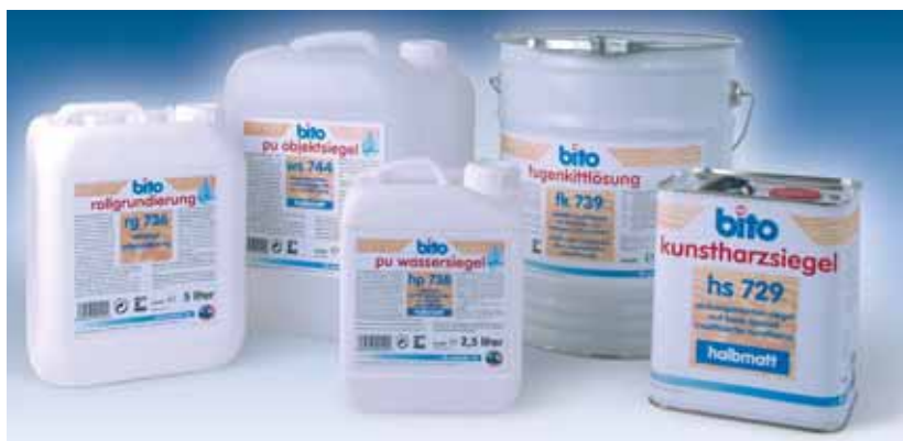
mit den neuen bito parkettprodukten legen wir ihnen qualität zu fußen.

den modernsten anforderungen der verarbeiter entsprechend und an umweltfreundliche standards angepasst präsentieren sich die neuen bito bodenwerkstoffe für parkett und andere holzböden. das sortiment deckt alle einsatzbereiche von der grundierung über fugenfüllung bis zur versiegelung ab. sorgfältig ausgewählte, natürliche rohstoffe schützen den belag nach der verarbeitung zuverlässig und bewahren die offene und lebendige struktur des holzbodens.