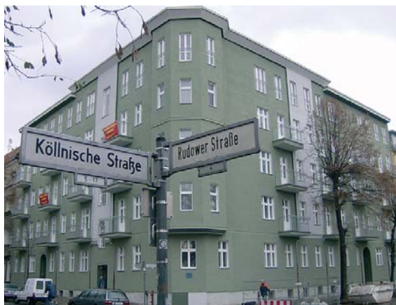
mit bito-produkten frisch saniert: das haus an der köllnischen straße 52 in berlin-niederschöneweide erstrahlt in neuem glanz.

jahrzehntelang war der nunmehr 95jährige altbau an der köllnischen straße 52 in berlin-niederschöneweide dem verfall preisgegeben. in diesem jahr konnte nun endlich die totalsanierung von fassade, treppenhäusern und wohnungen in angriff genommen werden, die von der firma felsmann gmbh aus berlin-kreuzberg durchgeführt werden sollte.