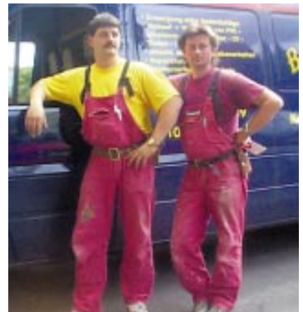
die firma krecklow und pommerening bodenbeläge gbr