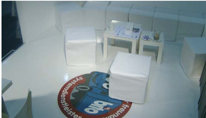
das neue bito bodenbeschichtungssystem bestand den härte-test und hielt den starken beanspruchungen auf der messe „bautec 2008“ stand. das eingelegte logo war nicht nur der hingucker sondern für viele besucher eine gestalterische inspiration.

beschichtung wurde das auf vlies gedruckte bito-logo eingelegt und anschließend mit der schützenden endbeschichtung bito garagenfinish 416 versiegelt. nicht nur ein echter hingucker, sondern auch ein härte-test für logo und beschichtung – mit gutem ergebnis: der boden überstand selbst die hohen trittbelastungen während der messewoche unbeschadet.