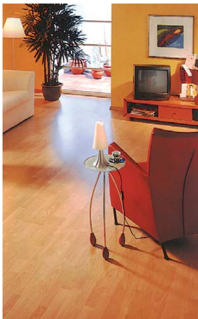
schönes design und angenehme akustik – mit dem neuen bito klick laminat wohnt sich's einfach besser.

die kantenversiegelung und die reinigungs- und pflegemöglichkeiten konnten weiter verbessert und vereinfacht werden. ausstattungen, wie die antistatische oberfläche, die die statische aufladung von personen beim begehen vermeidet,