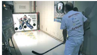
bito-giro-triathlon für die o2 world.

auch die neue bito-auftragsverwaltung, mit der einfach und sicher nahezu alle täglich anfallenden kaufmännischen aufgaben eines handwerkerbetriebes bewältigt werden können, fand großes interesse bei den besuchern. informieren sie weiterführend in diesem telegramm oder auch unter www.bitto-av.de .