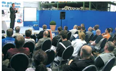
die vorträge sorgten für großes interesse beim fachpublikum.

im fokus standen die neuen produkte aus dem bodenbereich: die bito reiniger, die universal- und parkettkleber sowie die bito bodenbeschichtungen, mit denen individuelle böden in vielen farben kreativ gestaltet werden können.