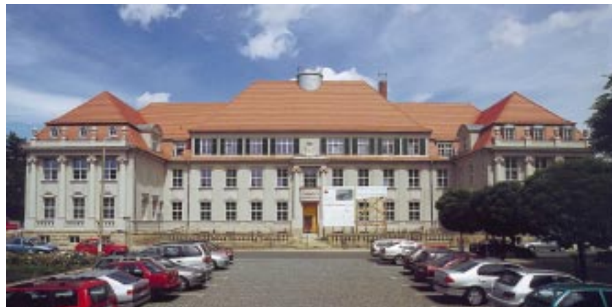
denkmalgeschützter bau auf geschichtsträchtigen boden: die neue verwaltung der burgenländischen sparkasse in zeitz.

asphalt-estrich einen skeptischen blick. bis zu 70 millimeter stark hatten die estrichleger ihn auf die alten holzdielen des 1913 errichteten gebäudes gegossen. das ergebnis war nicht eben überzeugend - abgesehen von der ungewöhnlichen und bedenklichen tiefe war der gussasphalt-estrich auch noch nachlässig abgequarzt worden, teilweise gab es regelrecht blanke stellen. keine ausgleichsmasse hätte auf einem derart unzureichenden estrich gehalten. solche schwierigkeiten allerdings sind für marktführer thomsit und seine partner vom fußbodenfachbetrieb teppichland eher herausforderung als problem - schließlich verfügt thomsit über einen technischen verkauf, der seinesgleichen sucht und dessen service die partner in anspruch nehmen. in diesem falle allerdings ging es nicht nur um partnerschaftliche hilfe: der marktführer