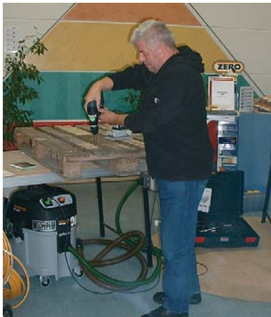
selbst ist der mann: bei den bito-werkzeugtagen können die geräte auch eigenhändig getestet werden.

im mittelpunkt stehen das fußboden schleifen