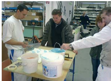
direkt vor ort bei den bito-profis lassen sich die kunden von rationeller werkzeugtechnik überzeugen.

mit band- und rundscheifer sowie die wandsanierung mit spachtel und vlies mit der wagner hc 940. als besonderes extra erhalten alle kunden an diesem tag eine kostenlose technische