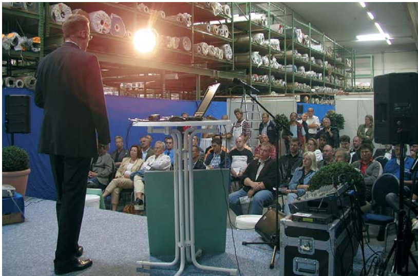
die fachvorträge kompetenter experten sind ein weiteres highlight auf der potsdamer bito-fachmesse am 27. märz.

der start ins neue bito-messe jahr 2009 findet wie immer pünktlich zum frühlingsbeginn in potsdam statt. dabei präsentiert sich die veranstaltung in ganz neuem format als die fachmesse für profis, auf der informationen rund um das fachhandwerk und innovative branchentrends natürlich an erster stelle stehen. aber auch der spaß für die ganze familie und entspannung vom arbeitsalltag werden an diesem tag nicht zu kurz kommen.