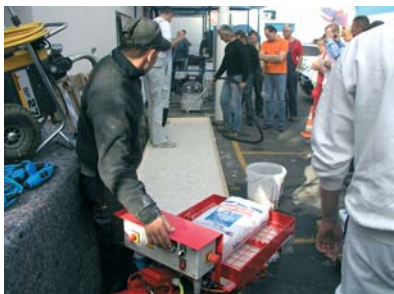
die neue spachtelmas-senpumpe bito floormaster fm 40 wird den kunden auf dem werkzeugtag in wilmersdorf vorgestellt

mit dem neuesten produkt aus der bito effizienzschmiede, der spachtelmas-senpumpe bito floormaster fm 40, kann flüssige spachtelmasse schnell und einfach auf großen flächen verteilt werden. somit wird viel wertvolle arbeitszeit und kosten beim spachteln