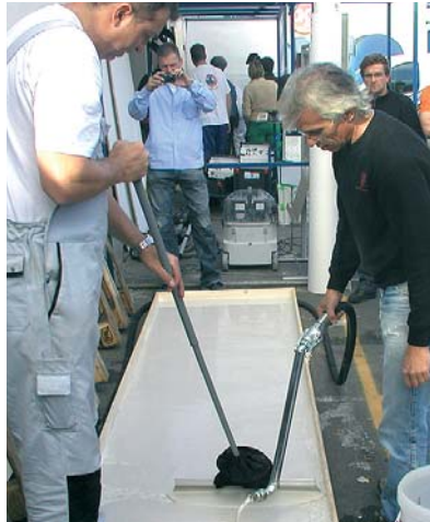
nach dem auftragen der spachtelmasse wird diese sofort gleichmäßig mit dem rakel verteilt

eingespart. 16 liter förderleistung pro minute und eine förderweite von bis zu 40 metern hat das praktische gerät zu bieten. die bito floormaster ist einfach zu handhaben, leicht zerlegbar und zu reinigen und bei bito jetzt für 3.999,- € netto zu erwerben.