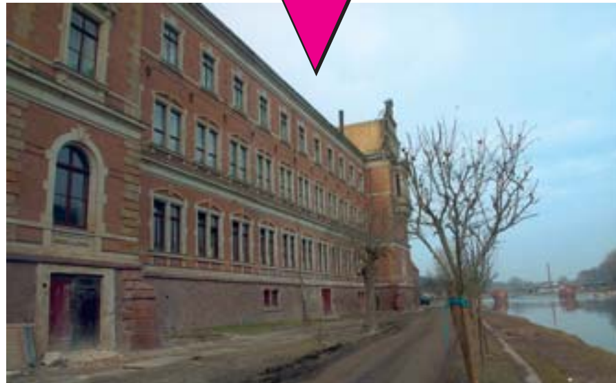
direkt am fuße der mulde liegt das st. augustin-gymnasium in grimma. noch sind spuren der verwüstung deutlich zu erkennen.

im bereich der privaten haushalte und im gewerbe eingesetzt werden. sach- und materialspenden sind in die summe nicht eingerechnet. „angesichts des gewaltigen baukostenvolumens mag die höhe der zuwendungen klein wirken“, so der bürgermeister, „doch der eindruck täuscht.“