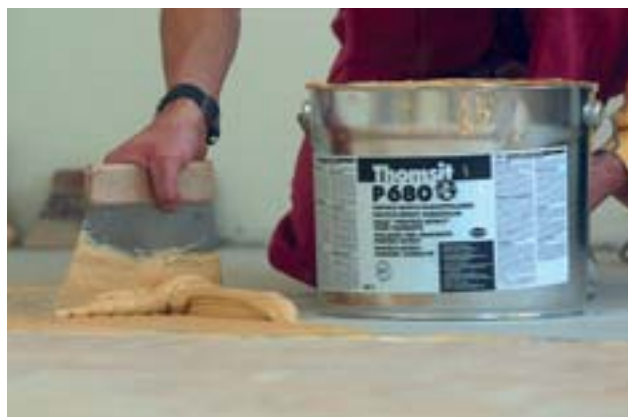
die elastische rezeptur des klebstoffs hält die schubkräfte des parketts im zaum.

die stadt befand sich im ausnahmestadium. auf der schreckensskala der größten naturkatastrophen rangierte die flut zwischenzeitlich hinter einem erdbeben in japan auf rang 2 – eine traurige bilanz. „um so glücklicher können wir uns schätzen, dass wir kein menschenleben zu beklagen hatten“, sagt bürgermeister matthias berger.