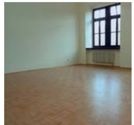
ohne die spendenbereitschaft wären die klassenräume kaum so zügig zu sanieren gewesen.

berger: „so zynisch es auch klingen mag, die flut hat auch positives bewirkt. denn die