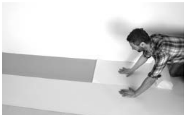
Abb. 2: Die wandseitige Bahn der Schutzfolie zunächst ein Stück flach abziehen.