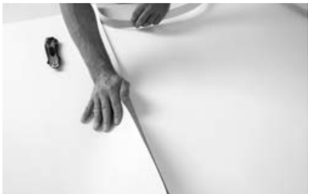
Abb. 7: Doppelschnitt: Zwei Bahnen leicht überlappen lassen und mit einem Cuttermesser durch beide Bahnen durchschneiden.

Abb. 6: Die nächste Bahn der Unterlage wird angelegt und ein Teil der Schutzfolie abgezogen. Der Boden muss die beiden Bahnen jeweils um mindestens 5 cm überlappen. Ggf. ist die Unterlage mittels Doppelschnitt (Abb 7/8) anzupassen.