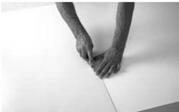
Abb. 8: Überstände nach dem Doppelschnitt entfernen. Doppelschnitt auch am Ende einer Bahn beim Anlegen der nächsten Bahn anwenden.

Abb. 7: Doppelschnitt: Zwei Bahnen leicht überlappen lassen und mit einem Cuttermesser durch beide Bahnen durchschneiden.