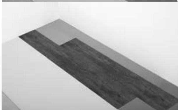
Abb. 4: Die zweite Diele mit ca. 40cm Versatz parallel an die erste Diele passgenau anlegen. Schutzfolie nach Bedarf Stück für Stück flach abziehen.