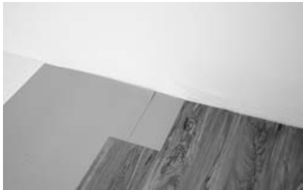
Abb. 6: Die nächste Bahn der Unterlage wird angelegt und ein Teil der Schutzfolie abgezogen. Der Boden muss die beiden Bahnen jeweils um mindestens 5 cm überlappen. Ggf. ist die Unterlage mittels Doppelschnitt (Abb 7/8) anzupassen.

Abb. 5: Im weiteren Verlauf die ersten beiden Dielenreihen wechselseitig verlegen um einen geraden Verlauf des Bodens zu gewährleisten. Nach Verlegung der ersten beiden Reihen die zweite Hälfte der Schutzfolie der ersten Bahn abziehen und mit der Verlegung des Bodens fortfahren.